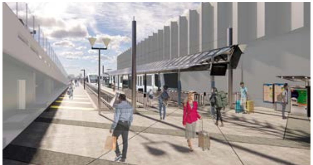
Bản vẽ cho thiết kế, có thể thay đổi