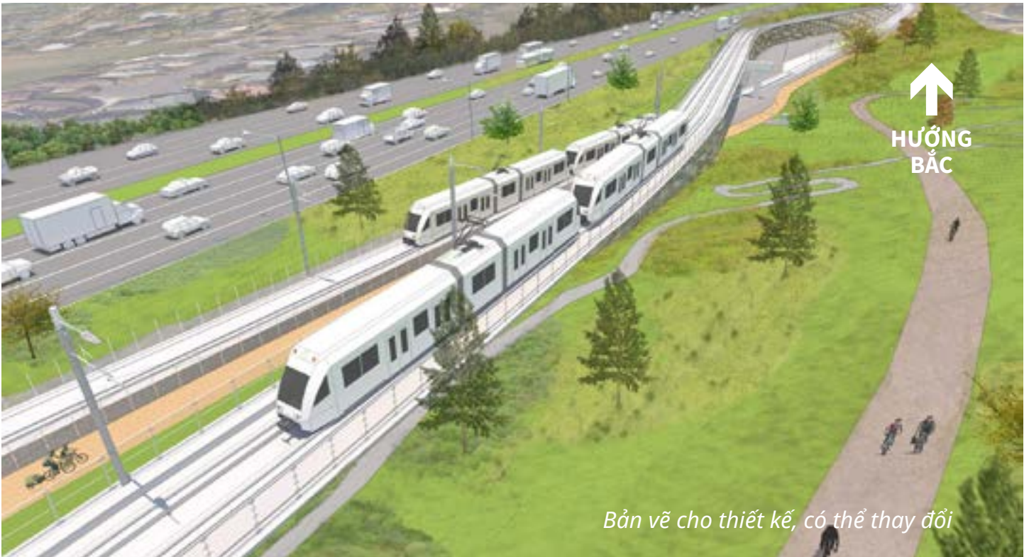
Bản vẽ cho thiết kế, có thể thay đổi

Xây hai cây cầu mới để hỗ trợ đường ray thứ hai: