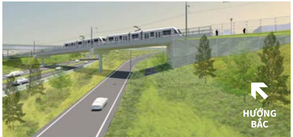
Bản vẽ cho thiết kế, có thể thay đổi

Đường ray thứ hai sẽ được xây dựng liền kề với đường ray hiện tại cùng với một lối đi đa năng mới giữa trạm MAX và NE 82nd Way.