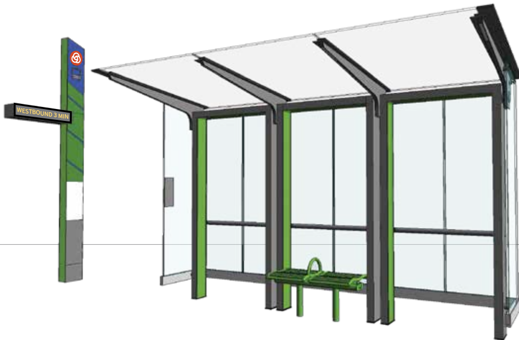
整体的概念可作调整；服务模式有待确定。

该专案将连接波特兰市中心和格里森市，沿东南 Division 街行走，穿过波特兰东南区和东区到克里夫蘭 (Cleveland) 轉乘停車點。新服務將跨越 Willamette River，越過 Tilikum Crossing (Bridge of the People)，將服務與 South Waterfront, OHSU, 和 PSU 銜接起來。